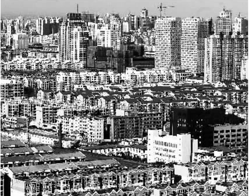
上图:二十世纪五十年代沈阳市铁西区工人新村一角(资料照片)。下图:沈阳铁西新区鸟瞰图(2007年6月8日摄)。