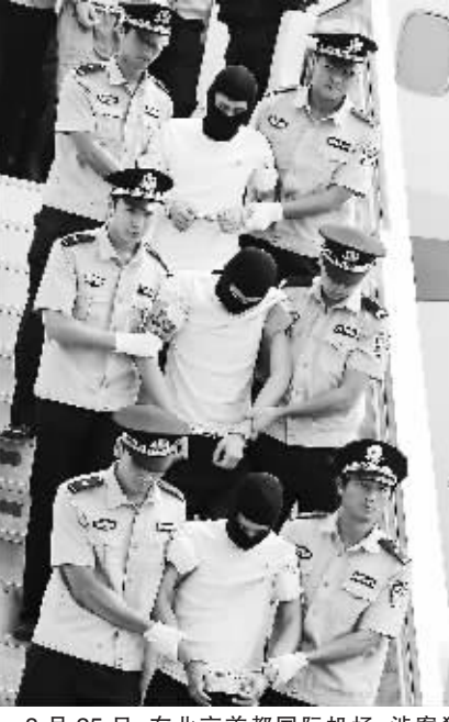
8月25日,在北京首都国际机场,涉案犯罪嫌疑人被押解下飞机。

同时,公安部部署福建、安徽等地公安机关在国内将涉案的24名犯罪嫌疑人抓获。 由于安哥拉正值总统大选,遣返犯罪嫌疑人工作未能如期进行。孟建柱再次致信马丁斯,马丁斯即将有关情况向多斯桑托斯总统作了报告,多斯桑托斯当即批准将犯罪嫌疑人全部遣返中国,并授权内政部全力配合中方做好遣返工作。