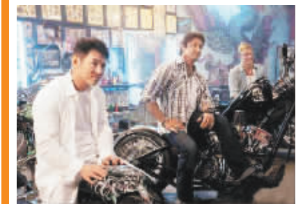
《敢死队2》中的李连杰(左)