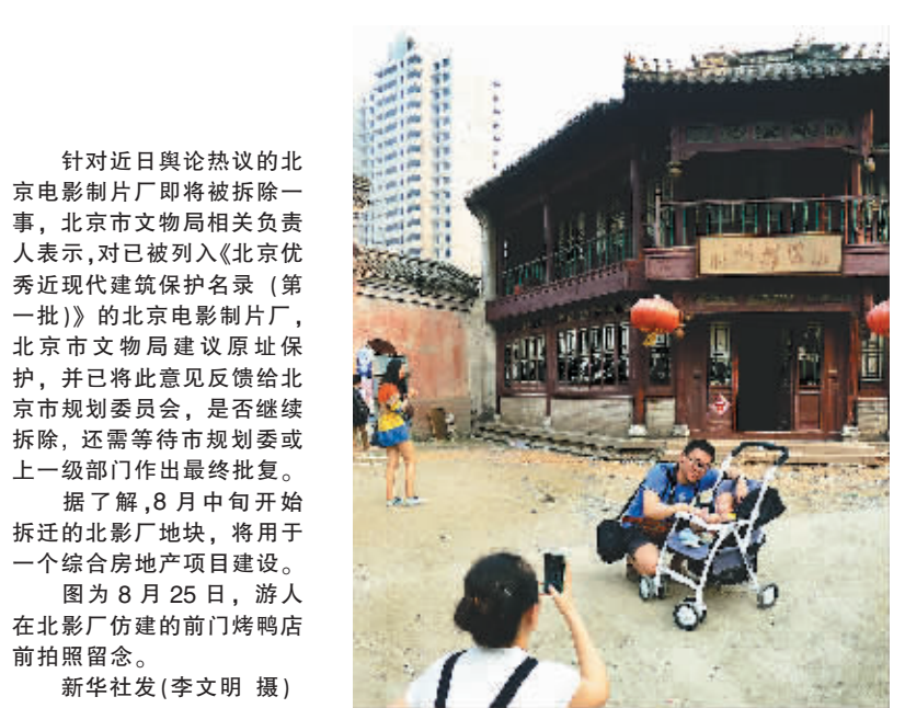
针对近日舆论热议的北京电影制片厂即将被拆除一事,北京市文物局相关负责人表示,对已被列入《北京优秀近现代建筑保护名录(第一批)》的北京电影制片厂,北京市文物局建议原址保护,并已将此意见反馈给北京市规划委员会,是否继续拆除,还需等待市规划委或上一级部门作出最终批复。