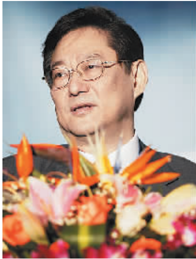
香港著名导演制片人吴思远