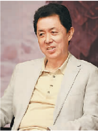
台湾著名导演朱延平

来又来过几次,也当过评委。”他认为,这种“缘分”正源于内地与港澳台电影界的深度合作,“我们的华语电影市场正走向更加开放的环境,这比20年前我们刚到内地拍电影时要好很多,港澳台电影人来自内地发展、评奖的机会也多了很多。” 吴思远对中国电影的发展十分看好,“现在我们国家电影市场形势非常好,我认为今年内地电影票房能达到170亿元,因为电影院银幕在不断增加,电影的观赏性也在不断提升。”在此形势下,内地和港澳台电影人更应该加强合作,共谋发展,做大做强华语电影市场,而非急于“走出去”。他说:“现在我们总有种观念,希望中国电影急着‘走出去’,这很不切实际。我