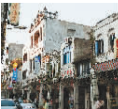
改造前的文南街已几乎失去骑楼风貌。