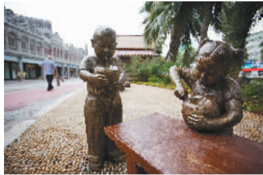
文南街上富有“椰”味的街头雕塑。

在改造前,市政府以恢复南洋风情商业街区为格调,注入文昌本土文化元素,还充分考虑到群众的接受程度,考虑其经营实际,尊重已经存在的业态,不搞一刀切。最终,在综合各界意见形成了《文南街规划改造方案》的总体定位:以文昌历史文化为依托,在保留原有骑楼建筑风格的基础上,围绕“文化、博览、商业、旅