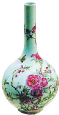
《天下收藏》节目中被视为赝品砸掉的乾隆款粉彩小胆瓶。

对于艺术品中的“赝品”,我们该如何去鉴定,早已不是问题的所在,而是通过“赝品”或许我们能发现艺术品的流变,有时候并非是我们所想象的那般完美,在这种情况下,我们看“赝品”,可能就耐人寻味了些。