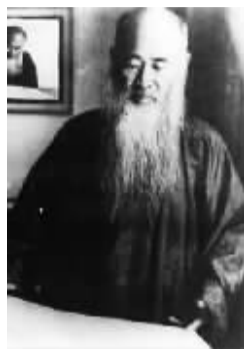
张大千不仅是一位杰出画家,而且是一位精通鉴定、善于模仿的高手,他的仿古画甚至达到了以假乱真的程度。