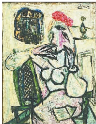
毕加索作品《戴红帽子的坐着的女人》是1963年外界赠送给埃文斯维尔博物馆的艺术品之一。尽管画上有毕加索的签名,但是博物馆还是认为它是赝品,并一直将其“雪藏”。

有意思的是,在意大利有个赝品博物馆,其收藏品多达6万件。而像毕加索、达利、伦勃朗、梵·高等艺术大师的作品也都曾有赝品出现。在艺术品的价值不断攀升的过程中,这巨大的利益让商家、制赝者看到了丰厚的利润,因此才不惜一切去铤而走险。不过,对藏家来说,艺术品依然是“收藏有风险,入市需谨慎”。