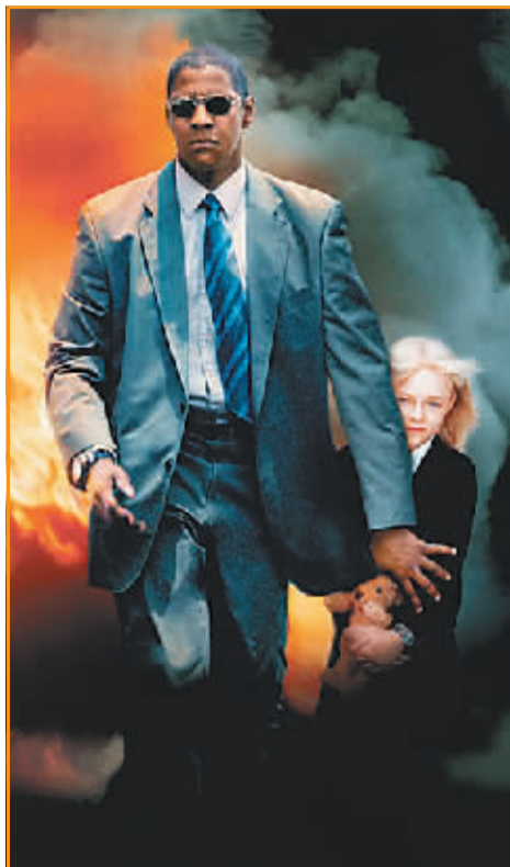
托尼·斯科特与丹泽尔·华盛顿曾经五次合作

8月19日，托尼·斯科特，一个电影梦幻的制造者，一个在他的电影中屡屡制造阳刚血性和惊险刺激的电影人，从洛杉矶文森特·托马斯大桥上一跃而下，以同样惊人的方式结束了自己的生命。没有人知道为什么。但是，我们知道的是世界影坛又少了一个男人，一个为男人制造梦想和童话的男人！