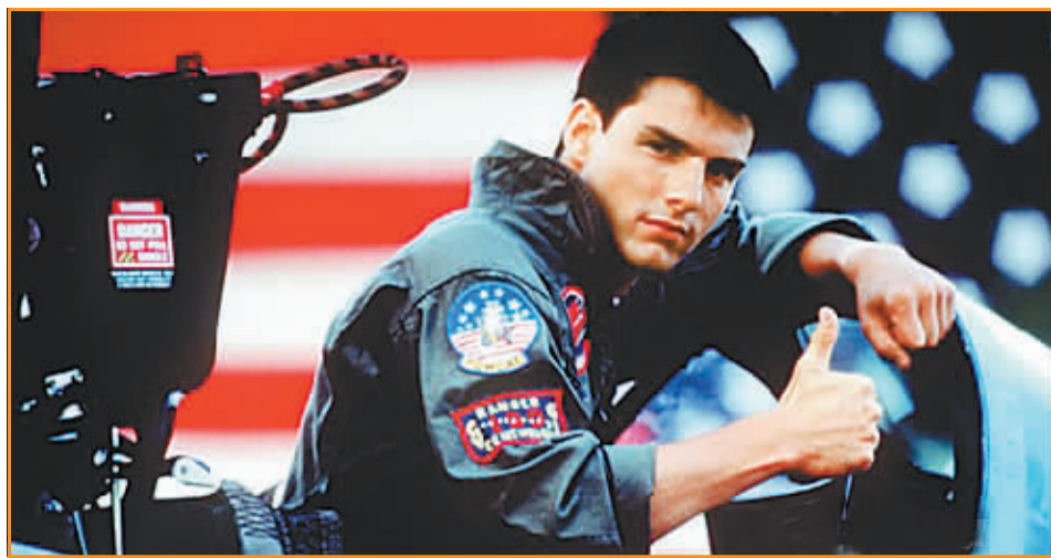
《壮志凌云》捧红了阿汤哥