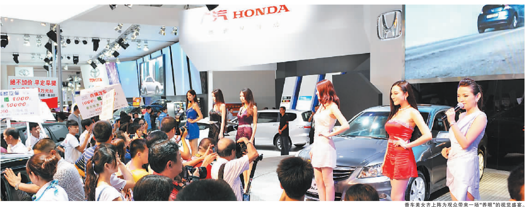
香车美女齐上阵为观众带来一场“养眼”的视觉盛宴。