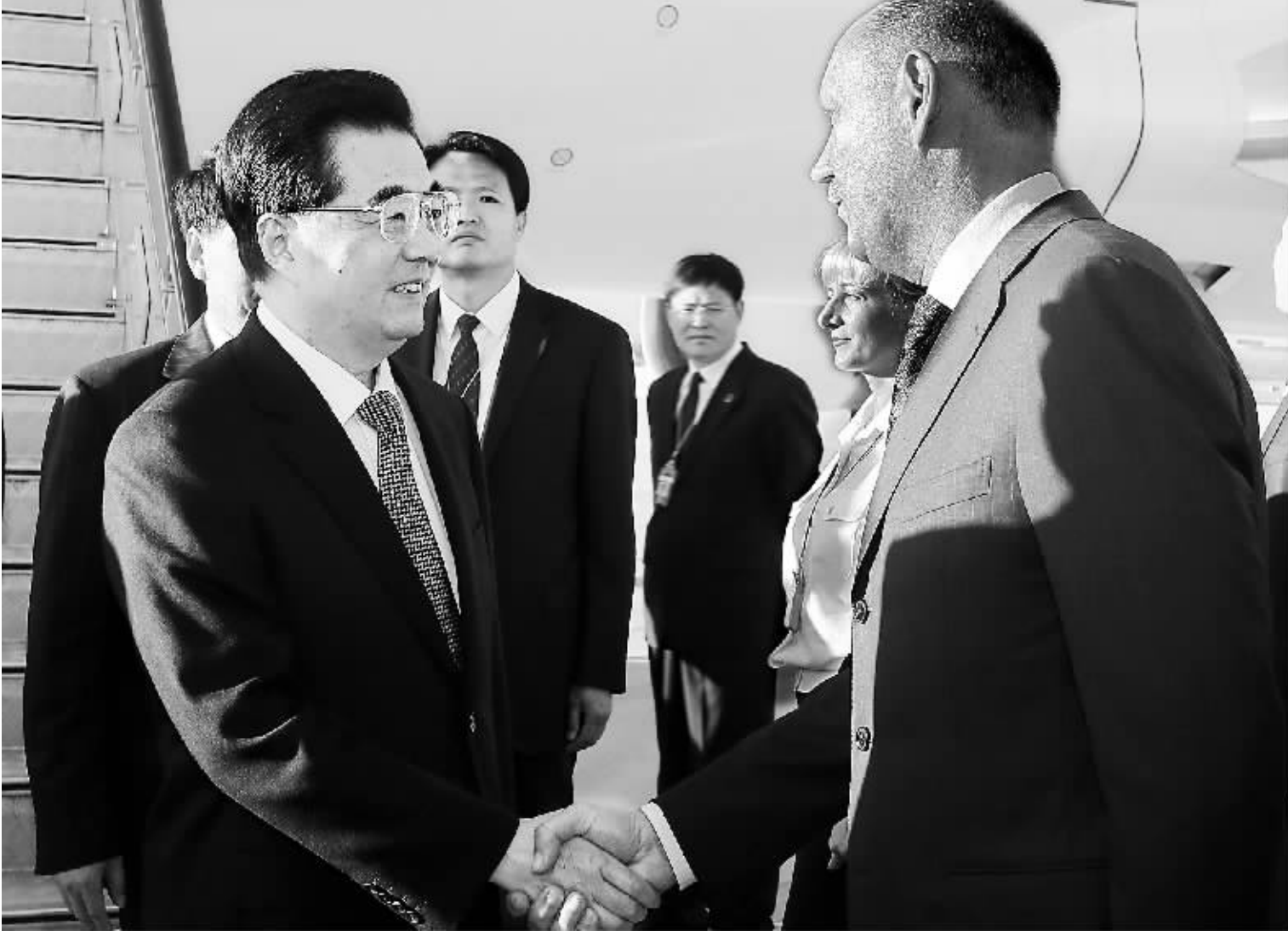
图为胡锦涛主席在机场受到俄罗斯政府及当地高级官员的热情迎接。

据新华社符拉迪沃斯托克9月6日电 国家主席胡锦涛6日抵达俄罗斯符拉迪沃斯托克，出席8日至9日举行的2012年亚太经合组织(APEC)第二十次领导人非正式会议。