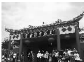
琼海王义方纪念馆。