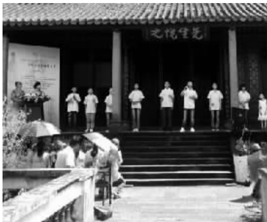
比赛现场。