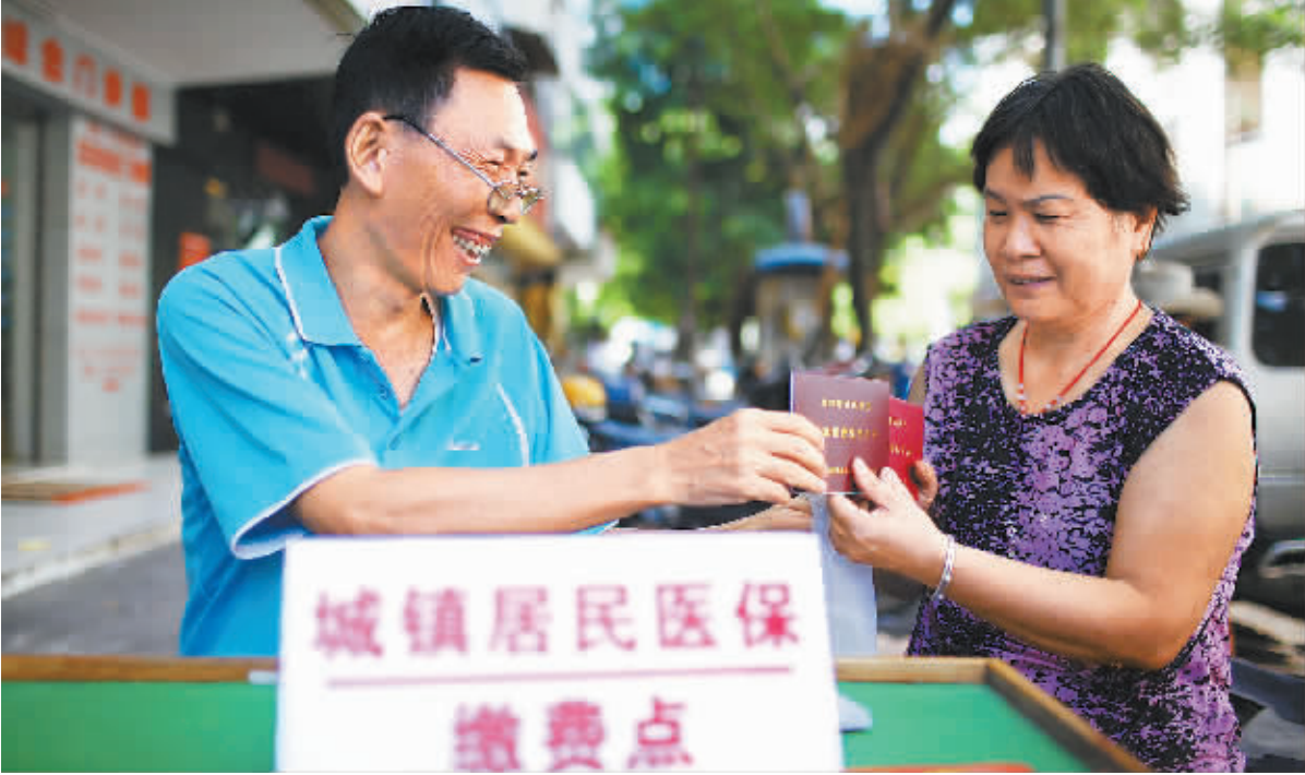
民生 工程让 海南百 姓享受 看得见 摸得着 的幸福 生活。图 为海口 社区工 作人员 为居民 办理城 镇居民 医保手 续。

春风吹拂,飘荡天涯。党的十六大以来,海南在科学发展观的指引下,实施了一系列顺民意、解民忧、惠民生的举措,以小财政办出了大民生。