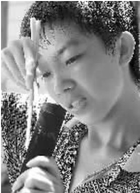
城里的孩子吃上自己动手制作的竹筒饭感觉很美好。