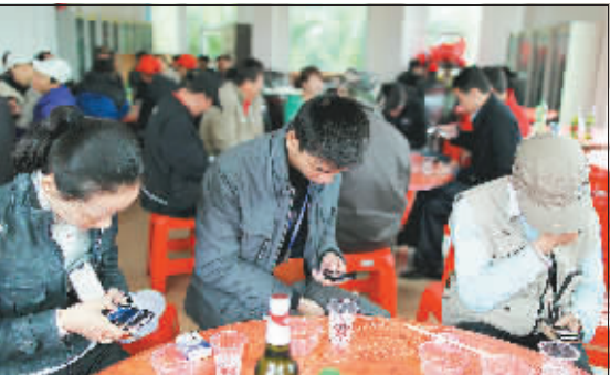
➡2011年3月18日,澄迈。餐桌前,彼此认识的人们各自低头玩手机,却忽视了与身边人的正常交流。