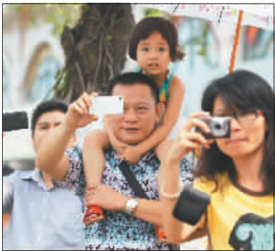
◀ 2012年9月16日上午,海口街头。人们在围观时,下意识掏出手机拍摄。