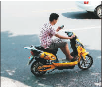
◀ 2012年7月27日,海口海秀东路。一位年轻人边骑电单车边看手机。在一个原本需要专心骑行的交通环境里,手机成为干扰源。