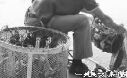
一只只大闸蟹爬进地笼

“大闸蟹是父母的最爱,每年中秋节我都会到‘蟹都汇’买大闸蟹,拿回家孝敬父母。听说今年中