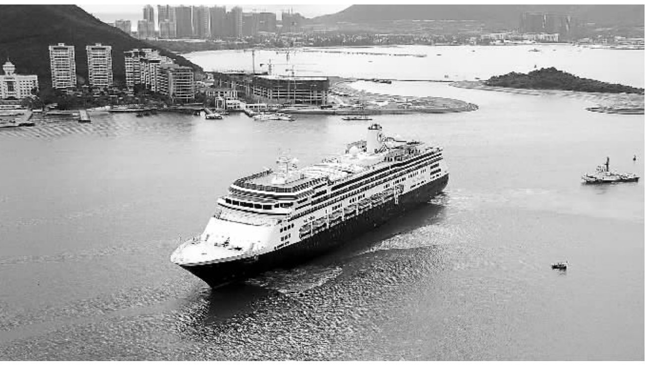
国外邮轮给三亚带来大量欧美游客。

1月19日，荷兰籍邮轮“赞丹号”满载千余名欧美、大洋洲游客首次到访三亚，揭开今年国际邮轮海南岛“闹春”的序幕。从农历新年至元宵节短短20天，就有28个邮轮航次造访三亚。