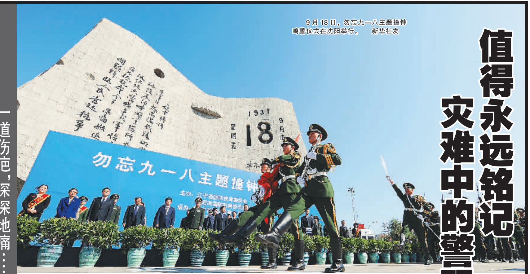
9 月 18 日，勿忘九一八主题撞钟鸣警仪式在沈阳举行。

帕内塔感谢梁光烈的邀请及中方的热情接待。他说，美中两国都是亚太重要国家，在反恐、反海盗、防扩散、维和、反毒品走私及人道主义救援与减灾方面拥有广泛的共同利益。美方的目标是将美中关系建成世界上最重要的双边关系，其中关键的是建立一个强有力的两军关系。