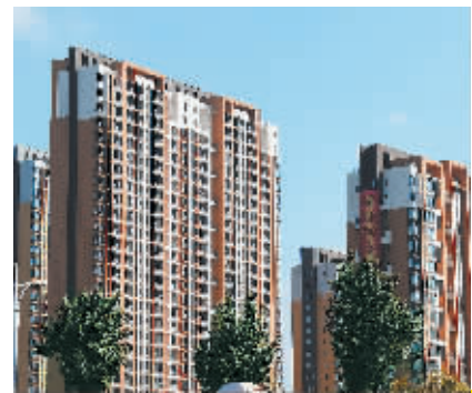
9月18日,国家统计局发布报告,8月份全国70个大中城市中,新建商品住宅(不含保障性住房)环比价格下降的城市有20个,持平的城市有14个,上涨的城市有36个。

陆续出台一些限制措施。8月,武汉启动预售资金监管并对预售价格严格审查;海口纠正限购政策漏洞;山东实施预售资金监管并逐步实施现房销售试点等。