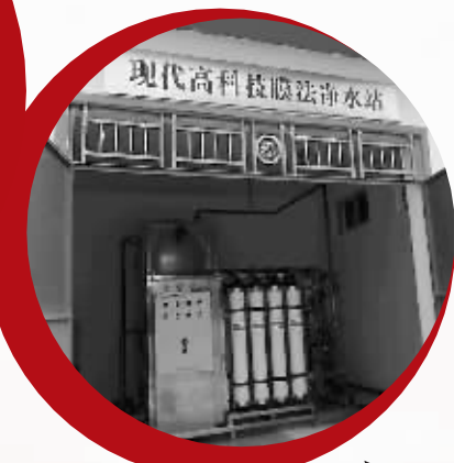
海南省政府采用立昇超滤技术实施“膜法”农村饮水安全工程。