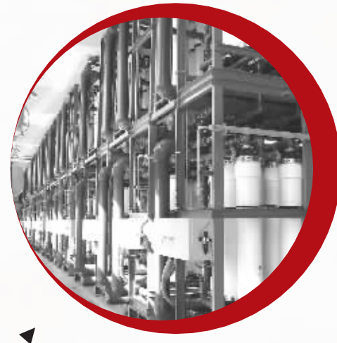
台湾高雄自来水厂采用立昇超滤膜已成功运行5年。