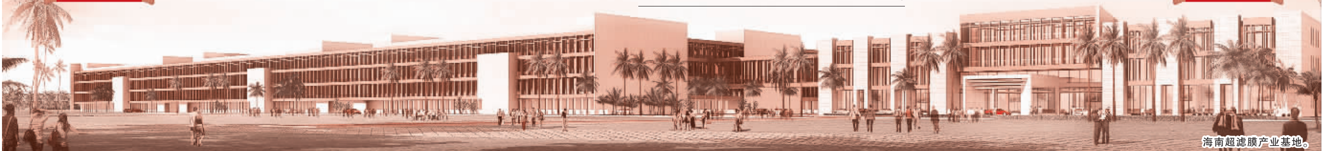
海南超滤膜产业基地。