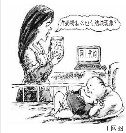
新西兰叫停奶粉代购,谁将受益,谁又将因此“受罪”?

然而,这种托人代购或网络代购,奶粉质量很难把握。尤其是网络代购奶粉,真假难辨。经此途径输出的奶粉未经新西兰初级产业部的出口检查监管,在干扰正常奶制品贸易的同时,也带来了检疫卫生和食品安全风险。此外,我国对婴儿配方奶粉的成分和标签有自己的具体要求,通过正规渠道进口到中国的婴儿配方奶粉必须符合