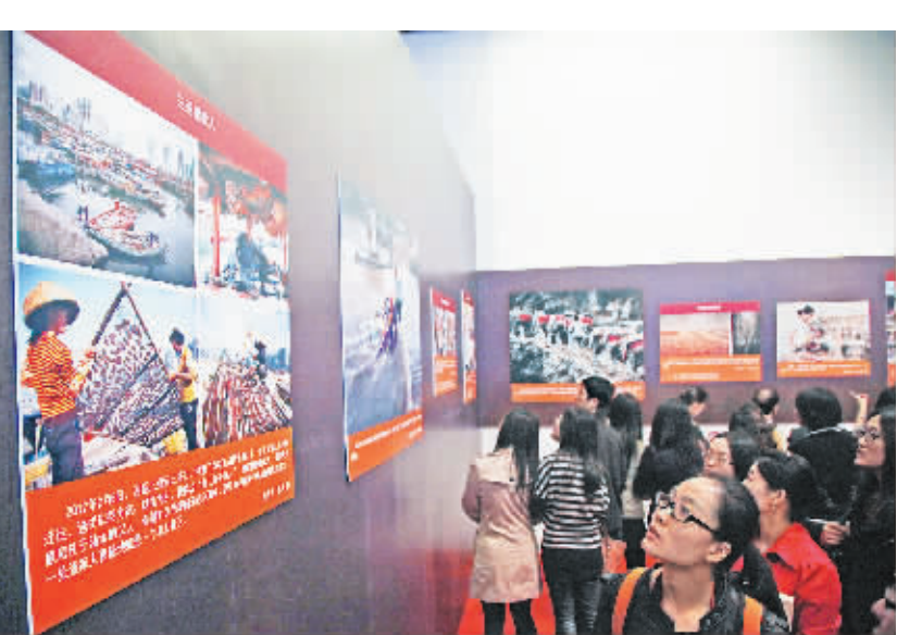
中央和北京市新闻单位编辑记者代表驻琼观赏展出作品《三亚置家人》。

本报讯 由中宣部、中央外宣办、国家广电总局、新闻出版总署和中国记协共同举办的“躬行大地——新闻战线‘走基层、转作风、改文风’活动图片展”10月18日在中国国家博物馆开幕。由中国记协牵头有关领导和专家组成评审委员会,按照展览主题对推荐作品进行审核筛选,海南日报报业集团选送的摄影作品《三亚置家人》入选本次展览。