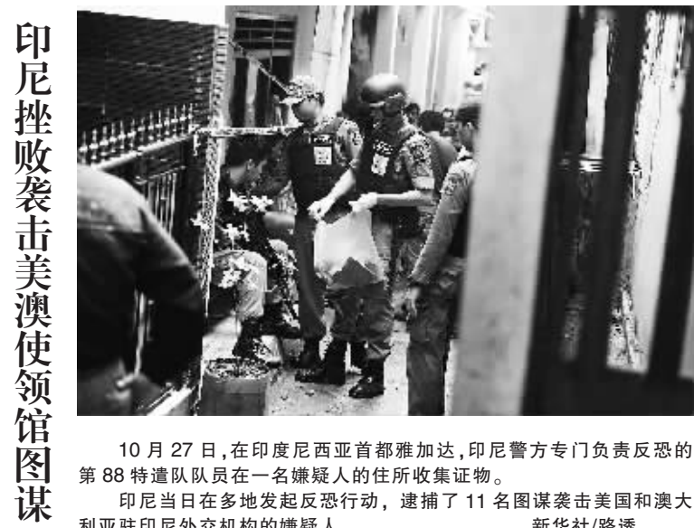
10 月 27 日,在印度尼西亚首都雅加达,印尼警方专门负责反恐的第 88 特遣队队员在一名嫌疑人的住所收集证据。印尼当日在多地发起反恐行动,逮捕了 11 名图谋袭击美国和澳大利亚驻印尼外交机构的嫌疑人。

飓风“桑迪”27 日继续北上,逼近美国东海岸,多个州进入紧急状态。气象专家和应急部门要求民众准备好应对暴雨、强风、洪水和大范围停电。这场美国人以人造怪物“弗兰肯斯坦”命名的“弗兰肯风暴”促使总统贝拉克·奥巴马和共和党总统候选人米特·罗姆尼分别取消多场竞选集会。气象预报说,预计“桑迪”29 日晚或 30 日在马里兰州至新英格兰地区南部之间的某处地点登陆,一些区域最大降雨量可能达 300 毫米且同时遭遇强冷空气。届时,“桑迪”和来自美国西部的初冬暴风雨以及来自加拿大的北极寒流将合流,演变为“弗兰肯风暴”,成为美国东部地区几十年未曾遭遇的超级风暴。应急部门官员估计,大约 5000 万至 6000 万人可能受影响。联邦紧急措施署署长克雷格·富盖特说,风暴将侵袭内陆,“不只是威胁沿海”。马里兰州、宾夕法尼亚州可能发生洪水,西弗吉尼亚州降雪量预计超过 60 厘米;长岛海峡以及下纽约湾和特拉华湾南部可能掀起至高 2.4 米的海浪。设在佛罗里达州迈阿密的国家飓风研究中心说,美东时间 27 日晚,“桑迪”位于南卡罗来纳州查尔斯顿东南偏东方向大约 540 公里处,中心附近风速增大至每小时 165 公里。预计“桑迪”登陆美国前威力不会有太大变化。“桑迪”先期袭击海地、古巴等加勒比海国家。海地民防局 27 日发布通告说,大西洋飓风“桑迪”袭击了这个加勒比岛国,已造成 44 人死亡,19 人失踪和 12 人受伤。海地民防局说,“桑迪”造成人员伤亡外,还使首都太子港等地大量建筑物受损,1.5 万人流离失所。风速每小时超过 150 公里的“桑迪”掀起巨浪,洪水泛滥,成千上万居民被迫撤离家园,许多村庄和房屋被洪水淹没。另据报道,“桑迪”同时还袭击了古巴、牙买加、巴哈马等加勒比岛国,造成不同程度的财产损失和人员伤亡。胡若愚(新华社供本报特稿)