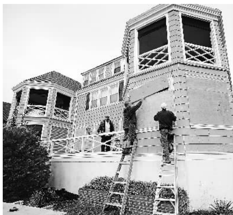
27 日,在美国新泽西州开普梅县,几名男子给旅馆钉上木板,以避免飓风“桑迪”可能带来的危害,东部沿岸多州已相继进入紧急状态。

飓风“桑迪”27 日继续北上,逼近美国东海岸,多个州进入紧急状态。气象专家和应急部门要求民众准备好应对暴雨、强风、洪水和大范围停电。这场美国人以人造怪物“弗兰肯斯坦”命名的“弗兰肯风暴”促使总统贝拉克·奥巴马和共和党总统候选人米特·罗姆尼分别取消多场竞选集会。气象预报说,预计“桑迪”29 日晚或 30 日在马里兰州至新英格兰地区南部之间的某处地点登陆,一些区域最大降雨量可能达 300 毫米且同时遭遇强冷空气。届时,“桑迪”和来自美国西部的初冬暴风雨以及来自加拿大的北极寒流将合流,演变为“弗兰肯风暴”,成为美国东部地区几十年未曾遭遇的超级风暴。应急部门官员估计,大约 5000 万至 6000 万人可能受影响。联邦紧急措施署署长克雷格·富盖特说,风暴将侵袭内陆,“不只是威胁沿海”。马里兰州、宾夕法尼亚州可能发生洪水,西弗吉尼亚州降雪量预计超过 60 厘米;长岛海峡以及下纽约湾和特拉华湾南部可能掀起至高 2.4 米的海浪。设在佛罗里达州迈阿密的国家飓风研究中心说,美东时间 27 日晚,“桑迪”位于南卡罗来纳州查尔斯顿东南偏东方向大约 540 公里处,中心附近风速增大至每小时 165 公里。预计“桑迪”登陆美国前威力不会有太大变化。“桑迪”先期袭击海地、古巴等加勒比海国家。海地民防局 27 日发布通告说,大西洋飓风“桑迪”袭击了这个加勒比岛国,已造成 44 人死亡,19 人失踪和 12 人受伤。海地民防局说,“桑迪”造成人员伤亡外,还使首都太子港等地大量建筑物受损,1.5 万人流离失所。风速每小时超过 150 公里的“桑迪”掀起巨浪,洪水泛滥,成千上万居民被迫撤离家园,许多村庄和房屋被洪水淹没。另据报道,“桑迪”同时还袭击了古巴、牙买加、巴哈马等加勒比岛国,造成不同程度的财产损失和人员伤亡。胡若愚(新华社供本报特稿)