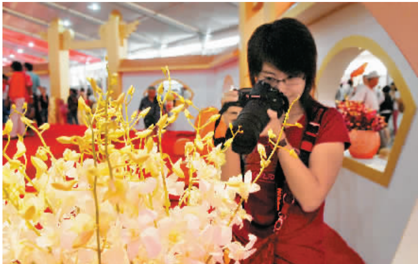
一年一度的中国(三亚)国际热带兰花博览会,已成为促进三亚兰花产业发展的重要平台。

并在自己QQ空间里写下一篇关于兰花的日志《且留清雅与馨香》。对于三亚高星级酒店为何热衷兰花,朱若郁认为,首先兰花品种繁多,色泽绚丽多彩且花期时间长,利于布展和装饰;其次,兰花属于高端花卉,与三亚高星级酒店的定位和品质对称;而三亚有热带兰花种植和培育基地,货源便利充足,价格也相对合理。