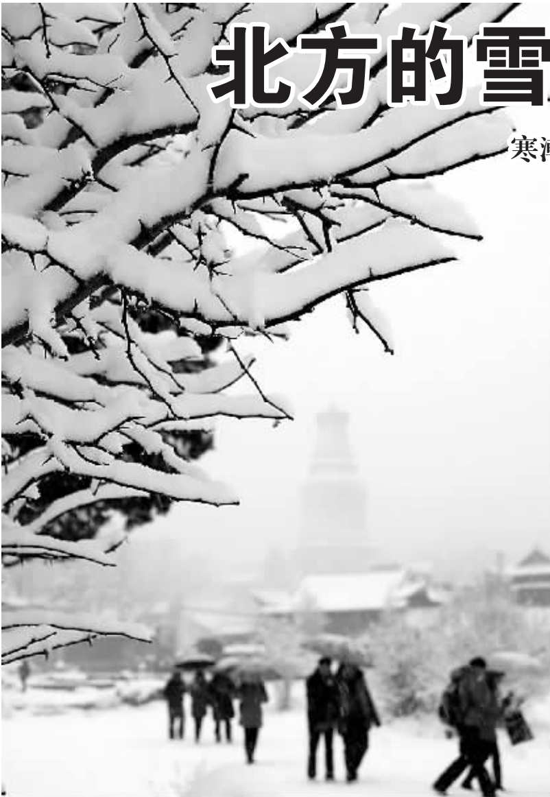
↑ 11月3日，游人在雪后的五台山观光游览。