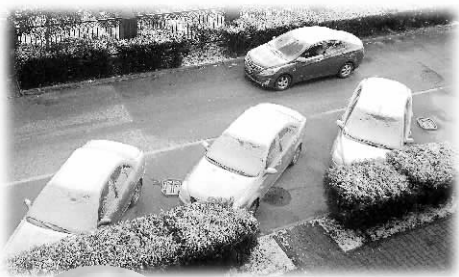
↑ 11月3日，呼和浩特市迎来入秋以来首场降雪。