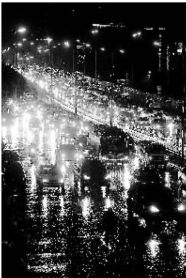
11月3日傍晚，北京西三环主辅路上的车辆在雨中缓慢行驶。

受这股冷空气影响，北京3日下起了小到中雨，最高气温比前一天下降了5度。内蒙古呼和浩特、陕西榆林、山西大同等地3日雪花纷飞，这是这些地方今年入秋以来的第一场雪。3日凌晨，连霍高速甘肃乌鞘岭段气温降到了零下17度，路面结冰，滞留车辆延绵了三、四十公里。