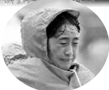
↑ 11月3日，安徽阜阳街头，行人顶风冒雨骑行在路上。