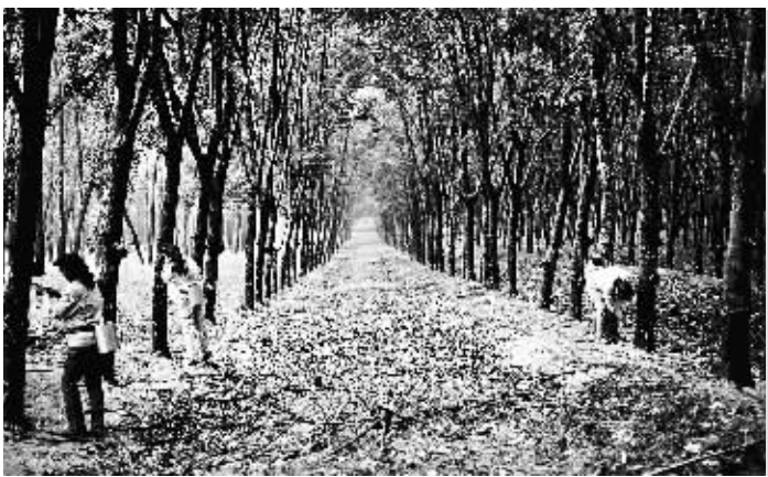
海南橡胶转型布局的一条主线是要从单纯的种植向粗加工、精深加工、物流贸易一体化延伸。图为海南橡胶集团邦溪分公司,万亩橡胶示范园区。

做强主业,而海南省委、省政府对海南农垦集团在“十二五”末实现产值千亿元的目标寄予厚望,双方优势互补性很强。