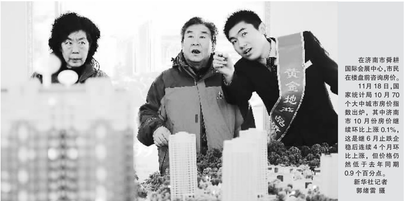
在济南市舜耕国际会展中心，市民在楼盘前咨询房价。

该开发商认为，未来上海房价会继续略微下降，刚需楼盘成交占比高是主要原因。据该开发商称，沪上中高端楼盘不会在年底推，也不会有太大的成交量。