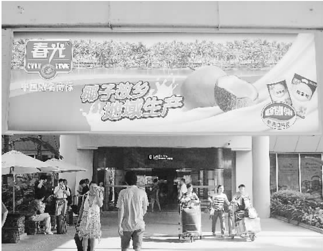
↑海口美兰机场春光广告牌