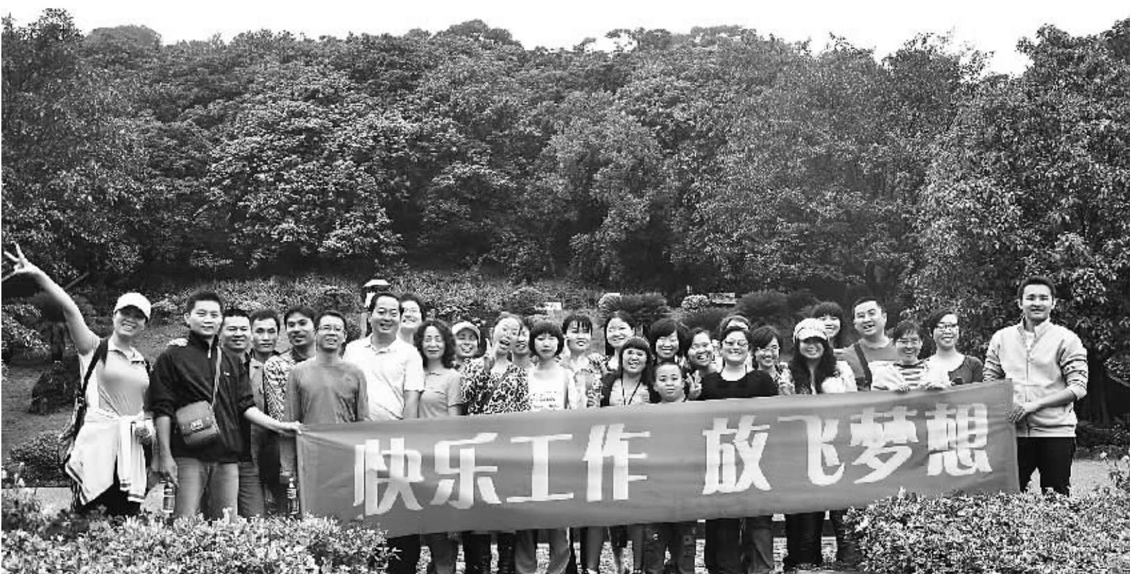
春光组织员工参加旅游活动。（资料照片）

桑梓情怀，赤子之心。1996年创立至今，春光食品在茁壮成长的同时，一直在以赤子之心努力回报海南这片热土。从优质美味的健康食品，到深入人心的温情服务；从海南旅游文化“名片”，到社会公益的履行者，春光将爱传递更远的地方。