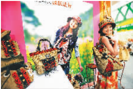
↑ 11月28日,在广西展馆,一位参展商向游客展示她的手工减压麻织品。