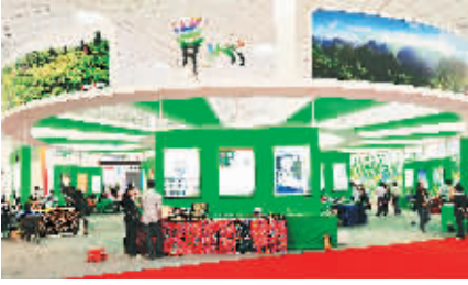
↑ 贵州展馆充满少数民族风情,从别具特色的展馆迎宾门就能一目了然。本报记者 古月 摄

综合配套改革试点地区,要大胆探索,先行先试,积累经验,摸索规律,为改革的全面推开作出积极的贡献。近年来,广东以深圳市、顺德区综合配套改革试点为突破口,在大部门体制、行政审批、培育发展和规范管理服务社会组织等行政体制改革和社会领域关键环节改革上取得了一定成效。今后广东将加快完善社会主义市场经济体制,积极稳妥地推进行政体制改革,着力建设精简、高效、廉洁的服务型政府。继续完善推广大部门体制改革,建立健全决策权、执行权、监督权既相互制约,又相互协调的权力结构和运行机制。推广深圳、顺德综合配套改革的成功经验,尽快建立法治化、国际化营商环境的制度框架。