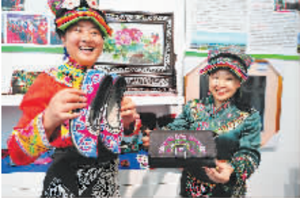
↑ 11月28日,在四川展馆,两位来自北川地震灾区的少数民族妇女向游客展示民族产品。本报记者 古月 摄