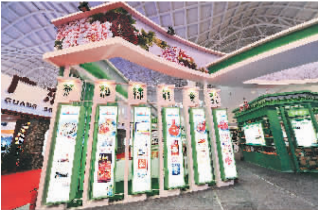
↑ 11月28日,湖南省展馆迎宾门。该展馆突出展示茶、酒等地方土特产。