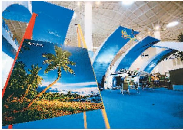
↑ 11月28日,在海南国际会展中心,准备就绪的海南三亚展馆。