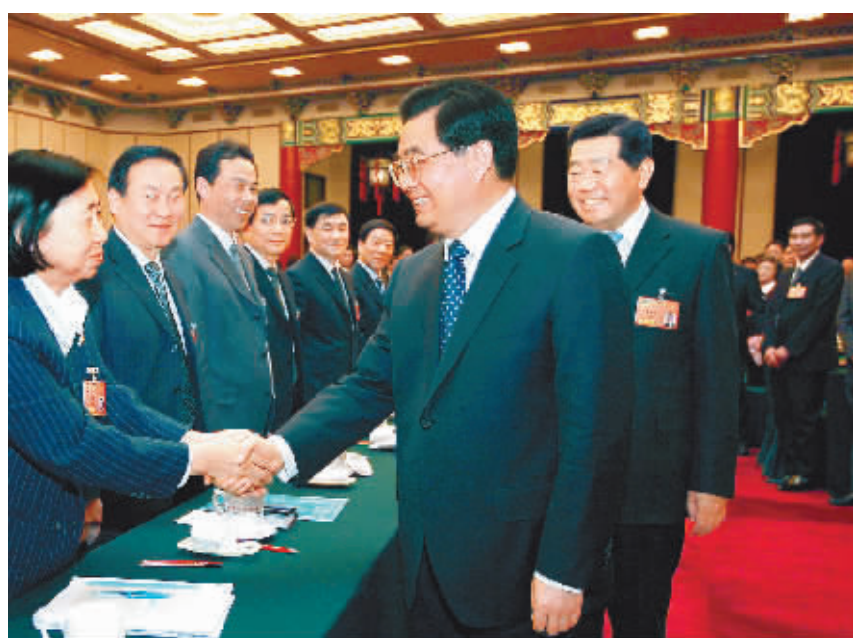
3月4日,中共中央总书记、国家主席、中央军委主席胡锦涛看望出席全国政协十一届一次会议的民革、台盟、台联委员,听取委员们的意见和建议,并发表重要讲话。中共中央政治局常委、全国政协十一届全国一次会议主席团常务主席贾庆林参加了看望和讨论。

族人民万众一心、团结奋斗的结果。我们要高举中国特色社会主义伟大旗帜,以邓小平理论和“三个代表”重要思想为指导,深入贯彻落实科学发展观,继续解放思想,坚持改革开放,推动科学发展,促进社会和谐,同心同德为实现中共十七大提出的各项任务而奋斗。 胡锦涛就发展两岸关系提出了重要意见。他指出,台湾问题事关祖国完全统一,事关国家核心利益。我们要遵循“和平统一、一国两制”的方针和现阶段发展两岸关系、推进祖国和平统一进程的八项主张,坚持一个中国原则决不动摇,争取和平统一的努力决不放弃,贯彻寄希望于台湾人民的方针决不改变,反对“台独”分裂活动决不妥协。 胡锦涛强调,事实已经并将继续证明:两岸关系和平发展,有利于两岸发展和稳定,必定造福两岸同胞;“台独”分裂活动,有害于两岸发展和稳定,必定给两岸同胞带来灾难。实现两岸关系和平发展,是两岸同胞的共同利益所系、共同责任所在。经过两岸同胞长期共同努力,推动两岸关系和平发展已经具有更为坚实的基础、更为强劲的动力、更为有利的条件,是大势所趋、人心所向。我们再次呼吁,两岸同胞团结起来, (下转第三版)