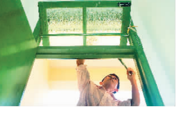
3月17日,林旺安置区,工人正给已建成的临时过渡安置房周转房粉刷油漆。

到商铺、农贸市场、家庭旅馆、医疗保障、社区活动中心等配套设施齐全。 林旺安置区投资近4亿元,工期1年,建筑面积16.4万平方米,用地面积201亩。林旺安置区分为60.90、120.150平方米四个户型,一共建设1000套住房。刘琼龙告诉记者,林旺安置区首批将安置庄大村、三灶村400户村民。 2007年5月,海棠湾开发区征地、拆迁、安置工作开始。目前,已经完成了一二期开发、搬迁居民安置区等1.3万亩用地的丈量、清点登记工作,完成发放征地补偿款、坟墓搬迁安置款3亿多元,完成了一期开发用地上2300多座坟墓的搬迁工作。 在全力推进征地拆迁的过程中,海棠湾镇也提出了许多奖励措施,促进拆迁安置顺利进行。根据拆迁安置方案,海棠湾镇村民按时签订征地拆迁补偿安置协议,接受公寓楼安置的,每户奖励2000元;按规定期限完成搬迁的,每户奖励1万元,搬迁费每户1000元;选择居住公寓楼的,每户赠送20平方米铺面和每人赠送10平方米出租房屋;每户房屋产权交换达不到60平方米的,补足60平方米;每座坟墓按时搬迁的,奖励3000元。