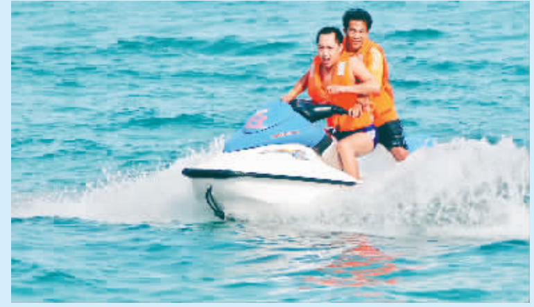
3月16日,游客在大东海乘风破浪。