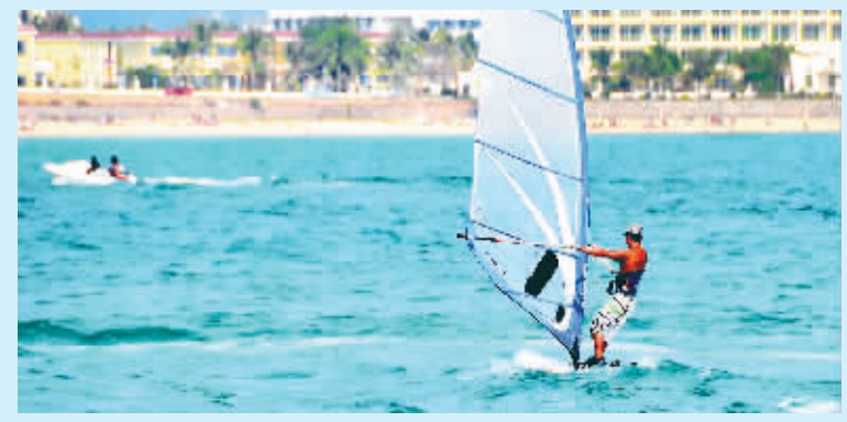
3月16日,游客在大海上逐波扬帆。