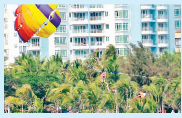
3月16日,游客在大东海景区内“展翅飞翔”。