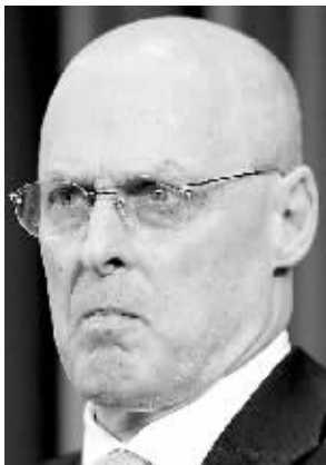
美财长呼吁改革 社保和医疗两项目

建立的，其目的是向面临流动性不足的商业银行提供资金。虽然美联储在信贷危机发生之后再降低贴现率，但商业银行大多不愿意通过贴现方式直接向美联储借款，原因是它们担心这么做会导致投资者对其健康状况担忧。