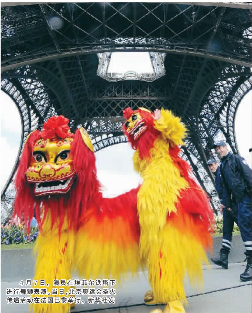
4月7日，演员在埃菲尔铁塔下进行舞狮表演。当日，北京奥运会圣火传递活动在法国巴黎举行。