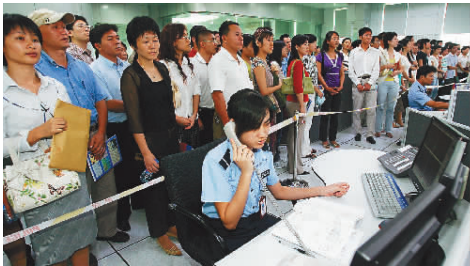
在海口市公安局,警务翻译志愿者参观110报警服务大厅。

因为有这批翻译志愿者的热心奉献,海口110报警服务平台实现了语言无盲点报警服务。