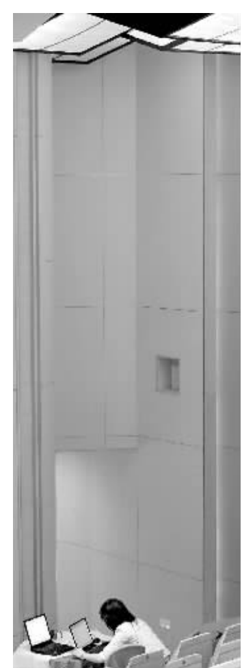
新闻发布会之后开工的记者