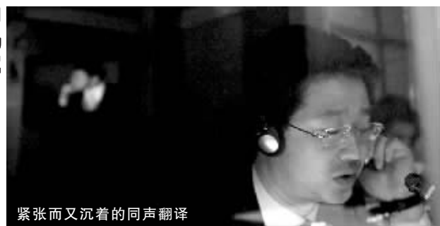
紧张而又沉着的同声翻译