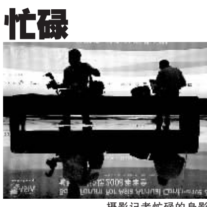
摄影记者忙碌的身影