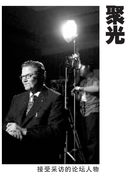
接受采访的论坛人物