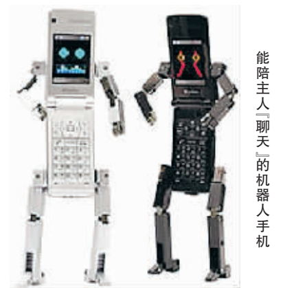
能陪主人“聊天”的机器人手机