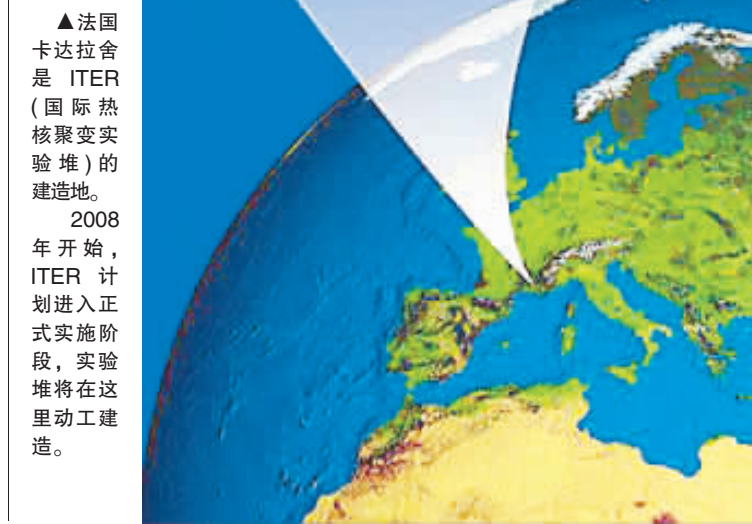
▲法国卡达拉舍是ITER(国际热核聚变实验堆)的建造地。