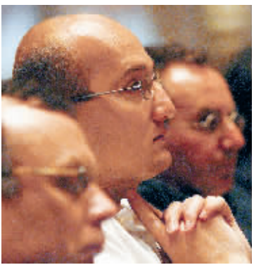
聚精会神倾听亚洲声音。