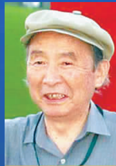
根本二郎 日本邮船株式会社名誉会长

全球化时代,必须尊重不同的文化、传统和价值观。用宽容和耐心来揭示这些不同文化、传统和价值观中的普遍性。