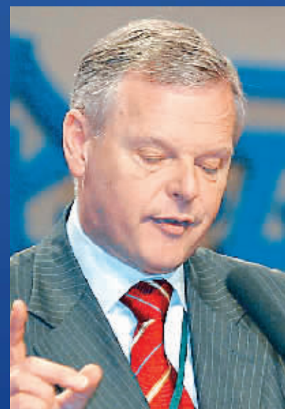
柯兹雷 荷兰飞利浦总裁