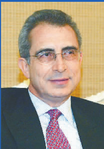
塞迪略 墨西哥前总统

亚洲区域经济一体化会使亚洲这个市场变得更大,各国的交流会更直接,这一点非常重要。