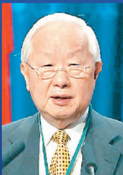
张忠谋 中国台湾积体电路公司董事长