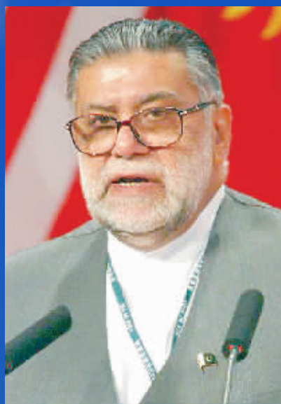
贾迈利 巴基斯坦总理

亚洲要实现共赢,必须坚持可持续发展,强调和睦相处。纵观全球经济发展,基于亚洲的这种可持续价值观是极好的一种模式。