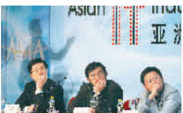
IT产业人士纵论信息技术市场。