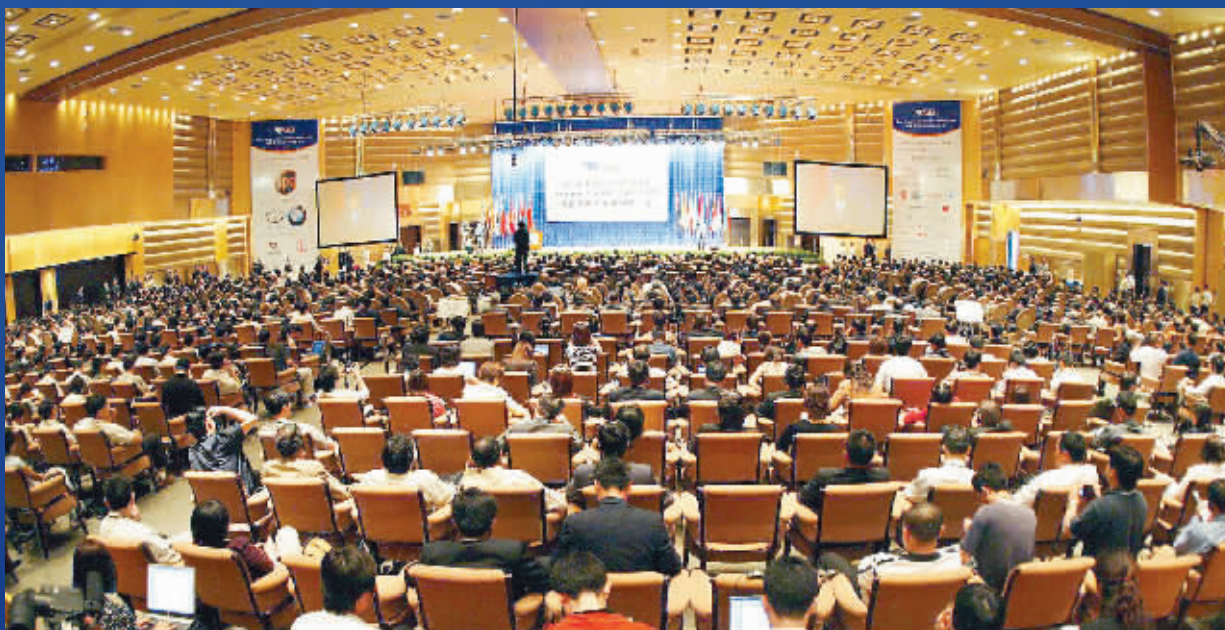
2004年年会与前两届相比,多个方面达到前所未有的高水平。日趋成熟的博鳌亚洲论坛,正在向世界级的国际论坛迈进。