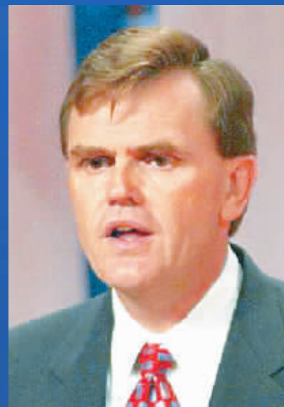
大卫·艾博尼 美国 UPS 总裁

亚洲区域经济一体化会使亚洲这个市场变得更大,各国的交流会更直接,这一点非常重要。