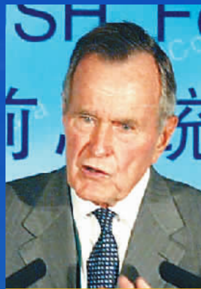
乔治·布什 美国前总统

现在世界自由贸易体系已能够让更多的国家受益,一个开放的市场和贸易体系,将给世界人民带来更多的实惠。