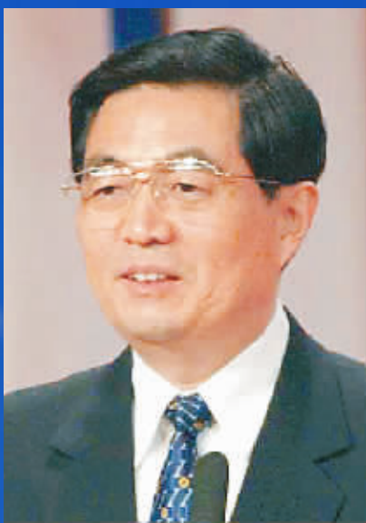
胡锦涛 中国国家主席

和平与发展仍是当今时代的主题,世界要和平、国家要发展、人民要合作是不可阻挡的历史潮流。我们高兴地看到,亚洲形势总体稳定,和平、发展、合作已成为亚洲前进的主流。