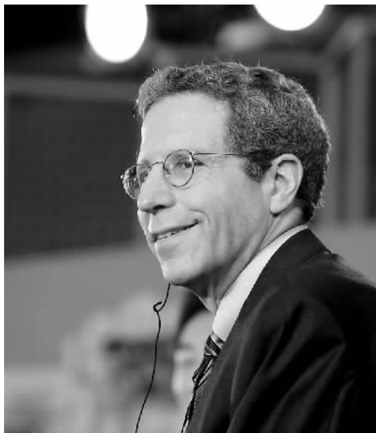
二〇〇七年诺贝尔经济学奖得主、普林斯顿高等研究院教授埃里克·马斯金。