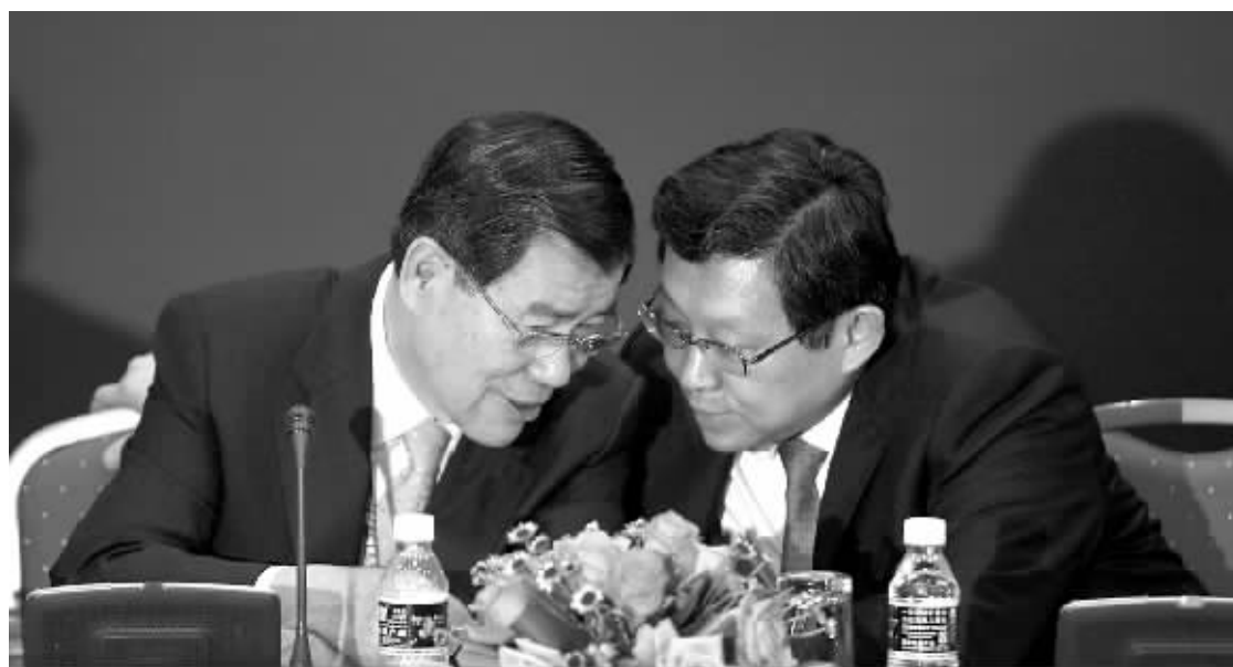
台湾两岸共同市场基金会董事长萧万长(左)和商务部部长陈德铭共同主持“台湾经济与两岸经贸展望”圆桌会议。会上他们俩在交流。

萧万长介绍了台湾新时期的三个经济发展策略：扩大公共投资、产业再造、开放松绑。他说，台湾未来的新经济政策，将对两岸经贸合作的扩大产生积极的作用，会带来两岸很多新的商机；两岸经贸关系会进一步加强，大陆的资金、市场、人才，与台湾有很多合作机会。 萧万长介绍说，今年5月份后，将会积极落实兑现竞选时的政见：开展两岸协商，实现两岸“三通”；开放大陆资金到台湾进行长期投资；促进两岸金融业的开放合作；放宽大陆观光客赴台限制。 萧万长表示，两岸经贸交流成就非凡，已具备相当的基础和规模，但仍有许多问题需要解决，最迫切的是推动两岸经贸关系正常化，并就有关经贸议题开展协商。 陈德铭在致辞中指出，20多年来，在两岸同胞的共同努力下，两岸经贸合作