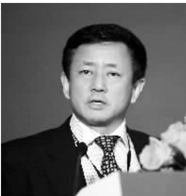
樊纲在午餐会上发言。

“中国目前情况仍然比较乐观。” 今天中午，北京国民经济研究所所长、中国人民银行货币政策委员会专家委员樊纲，在博鳌亚洲论坛“次贷危机及其对世界经济的影响”主题午餐会上表示，中国目前情况仍然比较乐观。他同时表示，中国情况比较复杂，资本流入越多，通货膨胀就会越强烈。世界上其他的地方信贷紧缩的同时，中国和其他的一些新兴经济体却要控制流动性过剩。 据了解，今年头两个月增加了1800亿美元的外汇储备，只有不到300亿美元是由于贸易顺差，外商直接投资占到了新增外部资本的70%。 樊纲认为，人民币升值在流入，甚至有一些非法资金的流入。资金流入可以为增长再贡献几个百分点，但这个问题实际上是非常复杂的。中国经济决策人要控制通胀，又要继续地增长，还要创造就业机会，并且要解决中国经济当中的长远问题。