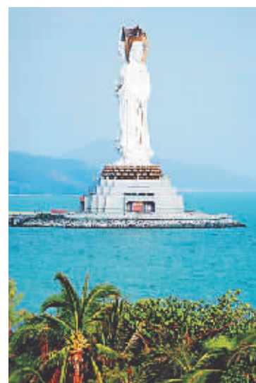
↑三亚南山108米海上观音像。