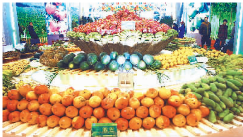
↑凭借天然温室优势，海南热带现代农业正在崛起。