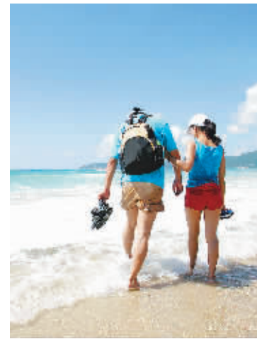
↑水净沙白的三亚亚龙湾国家旅游度假区。