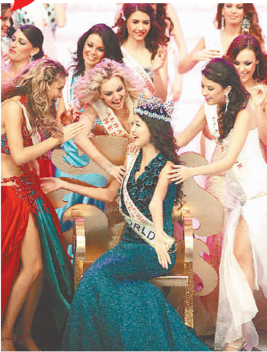
↑四届世界小姐总决赛的成功举办，加快了海南旅游国际化进程。