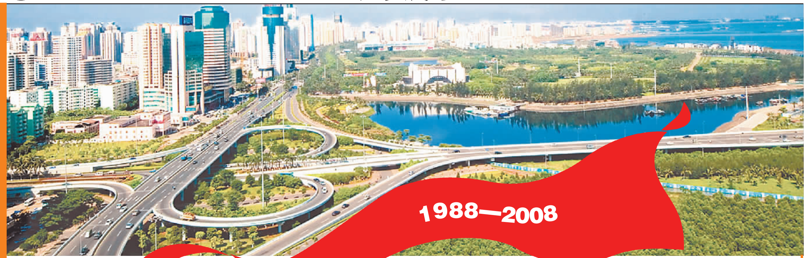
↑日新月异的海南省海口市城市风光。

1988年4月13日， 全国人大七届一次会议通过决议， 宣告了海南——中国第31个省 和最大经济特区的诞生。