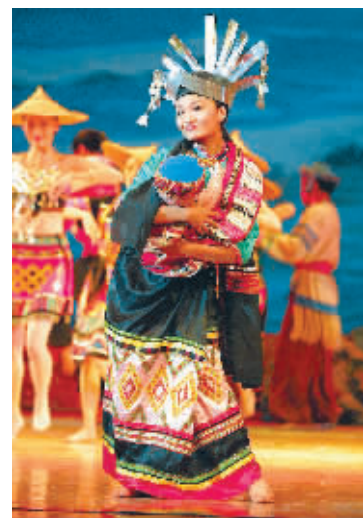
↑充满浓郁民族风情的海南黎族歌舞诗《达达瑟》。