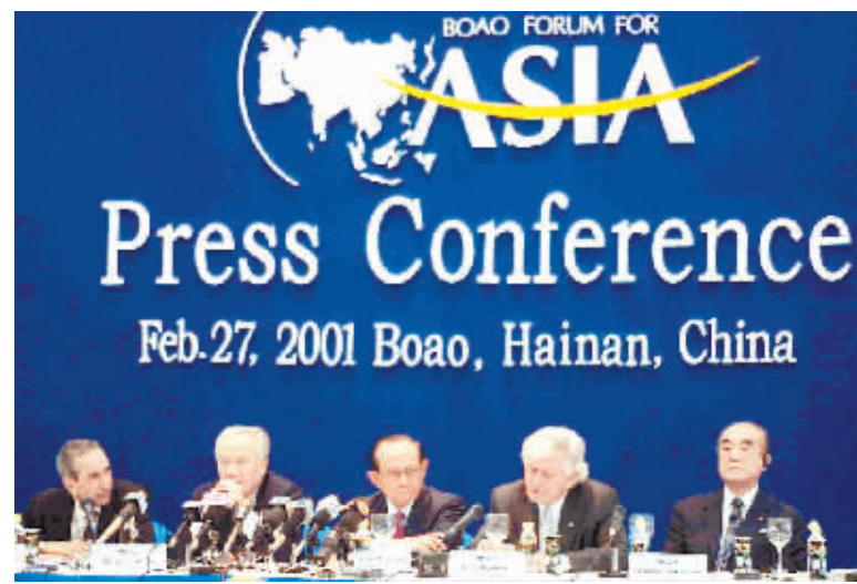
↑博鳌亚洲论坛日益成为国际脑力激荡的舞台。