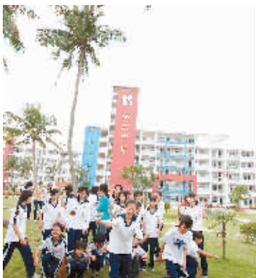
↑海南是我国著名侨乡之一，海外乡亲向来关心家乡公益事业。图为海外乡亲捐款建设的文昌市联东中学教学楼。