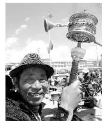
4月13日,面带微笑的拉萨市民在转经路上。随着春天的到来,雪域高原上的拉萨市空气中的氧气含量日渐增多,人们洋溢着笑容纷纷来到户外享受美好的春天。

在拉萨“3·14”打砸抢烧暴力事件中,西藏金融机构受损严重,13家金融机构网点遭到破坏,18台ATM机被砸,金融机构损失达900多万元。对于西藏金融机构遭到的破坏,达赖近日称是“银行截留中央拨款而被砸”。对此,中国银行业监督管理委员会西藏监管局、中国农业银行西藏分行、中国银行西藏分行等西藏金融部门的负责人一致表示,达赖的说法毫无事实根据。