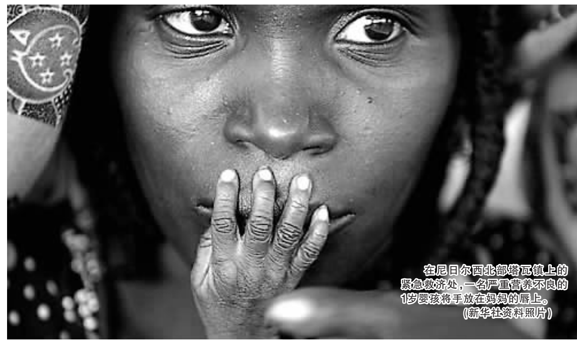
在尼日尔西北部塔瓦镇上的紧急救济处,一名严重营养不良的1岁男孩将手放在妈妈的唇上。

世界最大稻米进口国菲律宾宣布购买100万吨大米,加上许多出口国削减出口,国际米价近日连续创新高。粮食需求增加、种植面积减少、气候变迁和病虫害等原因,造成米价持续飙升。