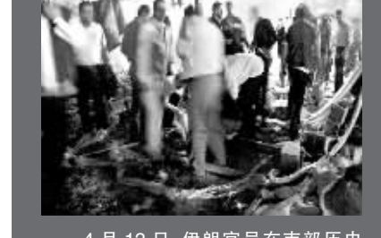
4月13日,伊朗官员在南部历史名城设拉子一个发生爆炸的清真寺现场进行检查。