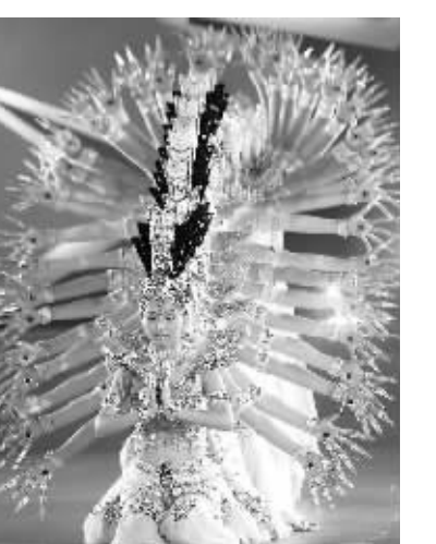
博鳌亚洲论坛2008年年会文艺晚会舞蹈节目,由中国残疾人艺术团演出的《千手观音》。

人们也许还记得,2005年博鳌亚洲论坛年会期间,在主场场国际会议中心西门举办的“钩映华夏”中国钧瓷珍品展,尤其是作为国礼的“易之华夏”的“华夏瓶”,让各国嘉宾赞赏不已。尼泊尔王国公主当下表示,会后要将这一中华国宝收藏皇宫。凤凰卫视著名资深时事评