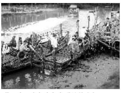
昔日海口市与海甸岛联结的小船