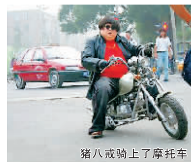
猪八戒骑上了摩托车

在各大论坛上,有关《魔幻手机》的帖子已经成为最热的帖。不少观众都惊呼:“我被这部剧给‘雷’倒了!”“对该剧的人物造型,大多数观众表示难以接