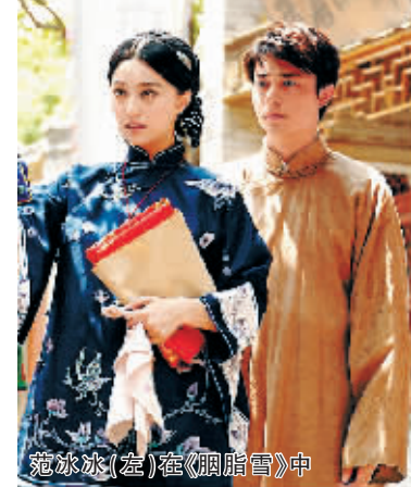
范冰冰(左)在《胭脂雪》中

范冰冰从1996年开始拍戏,到2007年正好10周年,她所取得的成绩也十分突出,当年,她主演的电影票房总和达3亿元人民币,并赢得台湾电影金马奖最佳女配角奖。(王新)