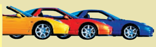
无论是在百度还是 Google 上搜索, SUV、crossover、上市、收购、精品小车、两厢车、奥运、国IV、召回、满意度等,都是08车市点击率最高的关键词。