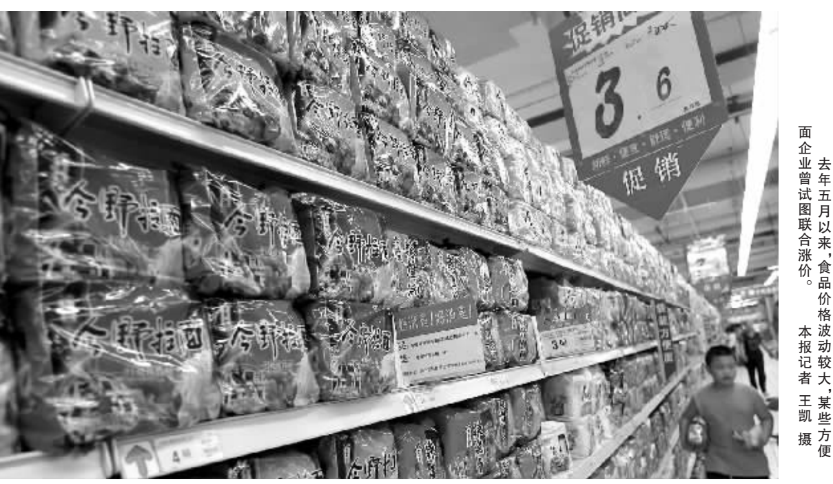
去年五月以来，食品价格波动较大，某些方便

今年以来，国际原油价格、粮食价格和原材料价格大幅上涨，使我们面临着国际初级产品持续大幅上涨的外部环境，价格形势比较严峻，面临着物价上涨的较大压力。 李晓超说，2007 年 CPI 对 2008 年全年翘尾影响 3.4 个百分点，要将今年 CPI 控制在 4.8% 左右的预期目标，新涨价因素需要控制在 1.4 个百分点以内。这意味着，今后 9 个月同比上涨不能超过 4.2%。 值得注意的是，上游产品价格从去年四季度以来开始攀升。工业品出厂价、原材料燃料动力供应价格、农业生产资料价格上涨都有所扩大，生产领域价格上涨向消费领域传导的压力在加大。劳动力成本上升通过增加企业成本推动了商品价格的上涨，这些都增大了居民消费价格上涨的压力。