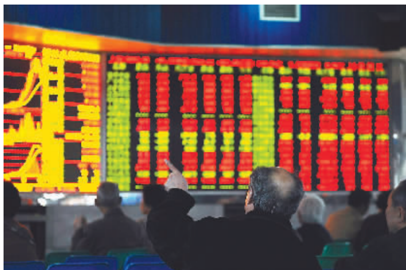
4月23日,股民在重庆一家证券营业部关注行情。当日,沪深股市双双大幅上涨。

本报讯 经国务院批准,财政部、国家税务总局决定从2008年4月24日起,调整证券(股票)交易印花税率,由现行3%调整为1%。此次印花税下调让后市充满了悬念,因此此次消息有可能已提前为市场所获知。