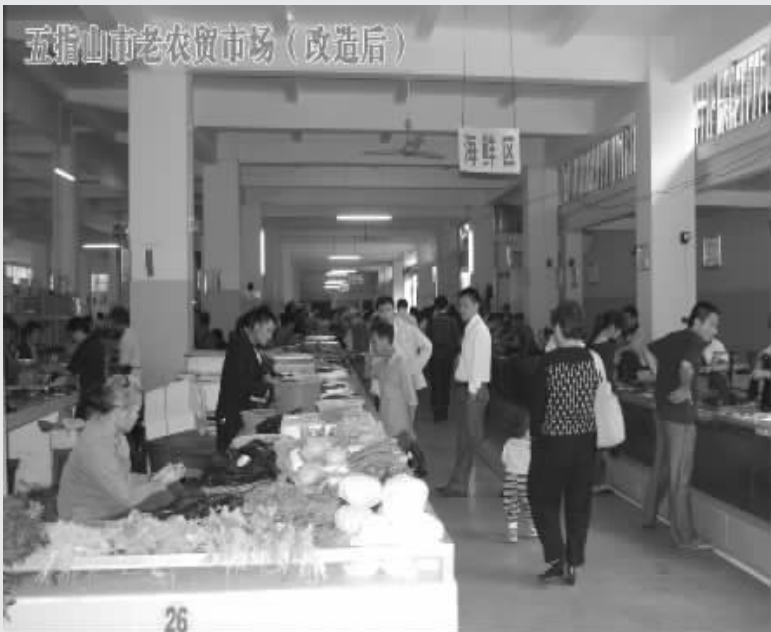
五指山市老农贸市场(改造后)