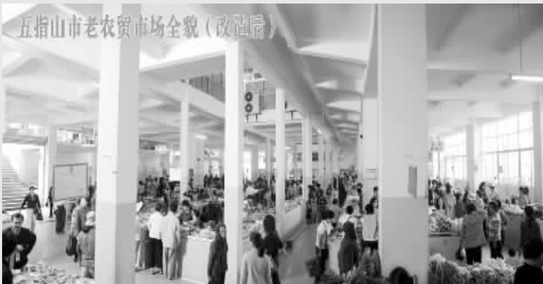
五指山市老农贸市场全貌(改造后)

五指山市商贸中心改造前是一个典型的“脏、乱、差、挤”的农贸市场。在市委市政府和省商务厅的支持指导下,鸿鑫物业公司投资三百多万元进行了改造,改造后达到了省级农贸市场标准,营业面积三层 6600 平米,经营商品数百种,为市民创造了一个温馨、舒适的购物环境。