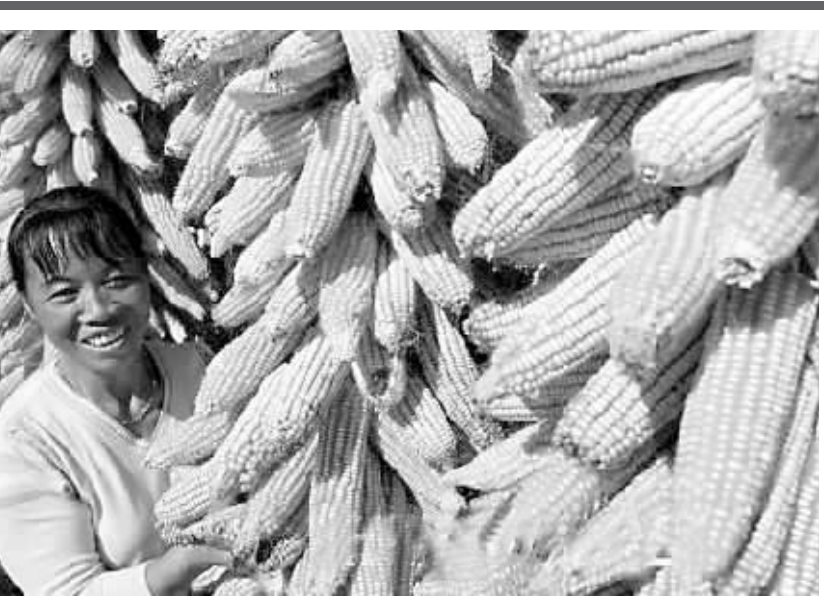
在翻晒刚收获的玉米(资料图片)。

种种迹象表明,尽管国际大宗农产品价格上涨对国内物价有一定“传导作用”,但由于我国农业和经济基本面仍很健康,在市场调节和国家政策的双重作用下,随着食品价