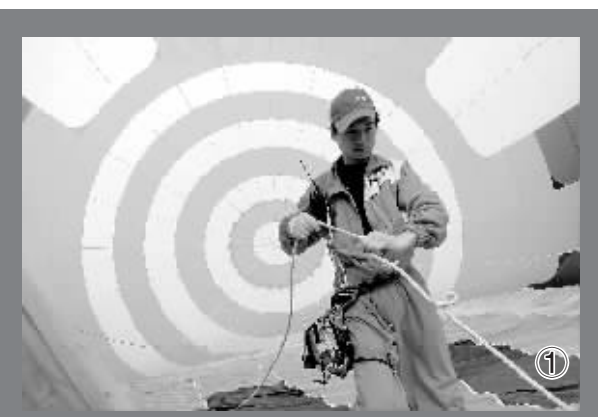
图①:队员正在为起飞做准备。图②:城市上空的热气球成一道靓丽风景。

为感谢“追球族”们一路追随,当30个热气球着陆万绿园后,海口热气球节组委会特别允许在场市民乘上热气球,进行热气球系留飞行体验。