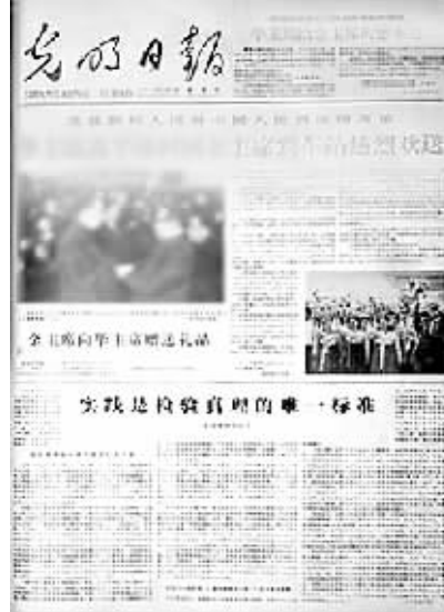
1978年5月11日,《光明日报》以特约评论员名义刊登《实践是检验真理的唯一标准》。