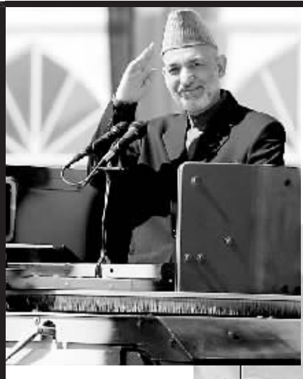
4月27日,阿富汗总统卡尔扎伊出席抗击苏联入侵胜利16周年阅兵庆典。