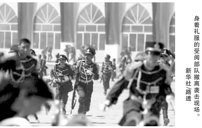
身着礼服的受阅部队撤离袭击现场。