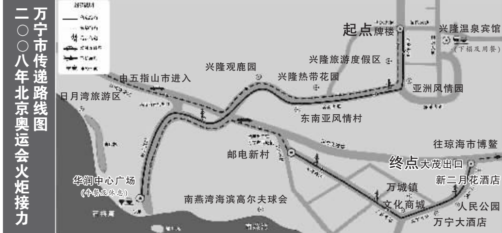
万宁市传递路线图 二〇〇八年北京奥运会火炬接力