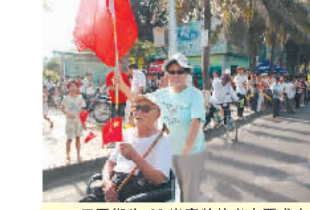
三亚街头,90岁高龄的老人要求女儿,举着红旗,推也要把他推来看奥运圣火!