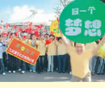
三亚市民高举“同一个梦想”迎接圣火到来。

此情此景,怎能不动人!难怪一位参与报道火炬传递的日本电视记者高呼:“太精彩了!这是我见过的最动人的火炬传递!” 祝福三亚!祝福奥运!祝福中国!(人民网)