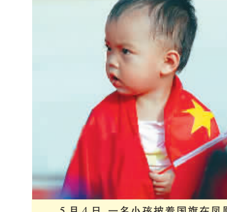
5月4日,一名小孩披着国旗在凤凰岛观看圣火传递。