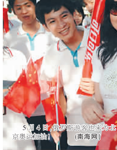
5月4日,俄罗斯游客也来为北京奥运加油!(南海网)

龙等都被认为有可能。但根据最新消息,三亚的第一棒由滑冰运动员杨扬担任。杨扬在2002年盐湖城冬奥会上获得两金,实现了中国军团在冬奥会上金牌零的突破。她在个人体育生涯中共获得59枚金牌,是迄今为止获得世界冠军最多的中国运动员。