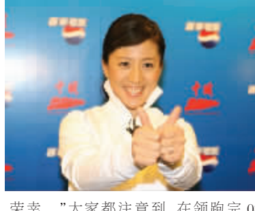
荣幸。”大家都注意到,在领跑完08盛会中国大陆的第一程后,杨扬竖起了自己的双手拇指,这个动作正是2008百事“舞动中国”主题活动的标志。“每个运动员都有激励自己的方式,以往比赛前,我就会竖

来到热带三亚,杨扬为08盛会的热情所感染:“无论冬季运动还是夏季运动,作为中国运动员,我都为2008北京08盛会感到自豪。能够在这里领跑,我感到无比