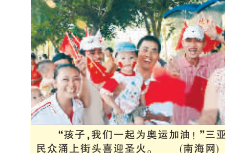
“孩子,我们一起为奥运加油!”三亚民众涌上街头喜迎圣火。

中国的火就是要烧 ——中国火炬灭不了 困难灭了 苦难灭了 苦难灭了 苦难灭了 ——中国火炬灭不了 让他们叫吧,让他们闹 中国火炬灭不了 (华生在线-精英博客)